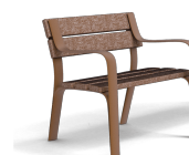
Citizen Eco UM301SPR